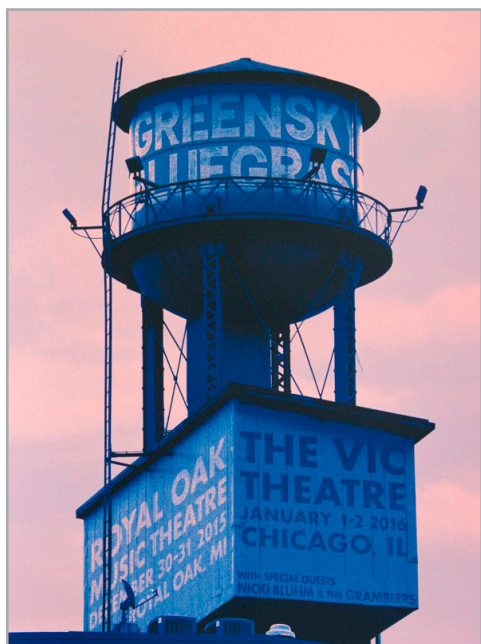
Dan MacAdam :: „Greensky Bluegrass“ Chicago :: 2016 :: Siebdruck mit 4 Sieben

COLORED GIGS goes Bavaria - again! Nachdem die beiden sächsischen Metropolen von den Machern von Colored Gigs erfolgreich für die farbenfrohe Posterkunst eingenommen werden konnten, ist auch die bajuvarische Hauptstadt im vergangenen Jahr zum ersten Mal in den Genuss des ‚Kunstaufbau Ost‘ gekommen. Und die Münchner waren begeistert!