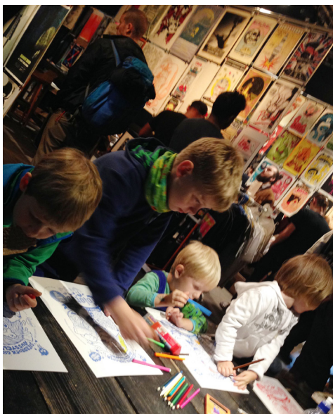
Eindrücke von der Colored Gigs Postershow in Dresden, mit Malecke zur Posterkünstler-Nachwuchsförderung.

International Silkscreen Gigposter Exhibitions