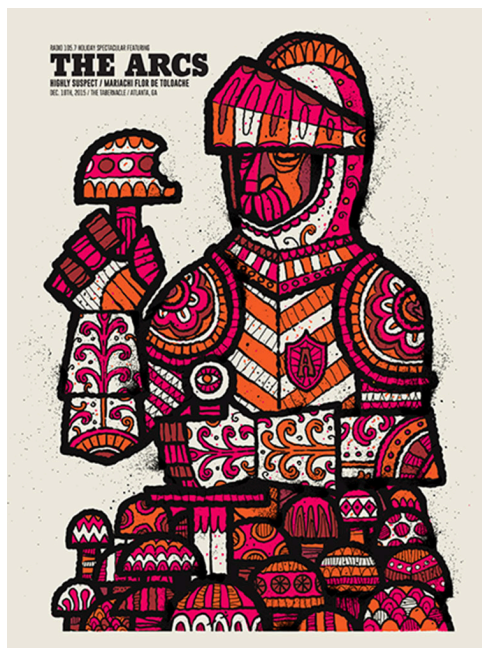
Methane :: „The Arcs“ Atlanta :: 2015 :: Siebdruck mit 3 Sieben